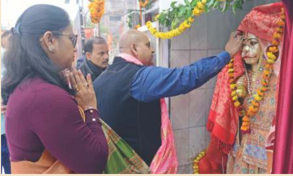
शारदा नगर में हनुमान जी का तिलक