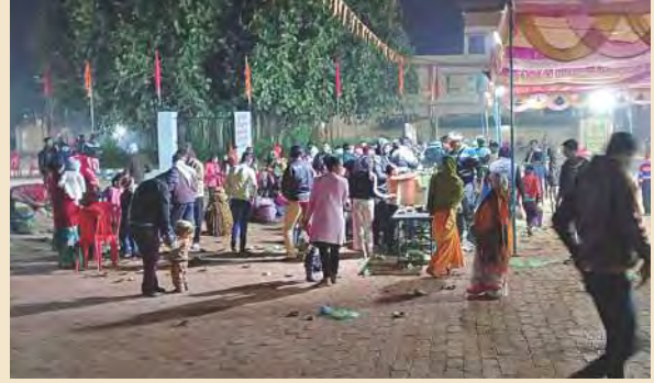
पवन तनय आश्रम में देर रात तक होता रहा भंडारा प्रसाद वितरण