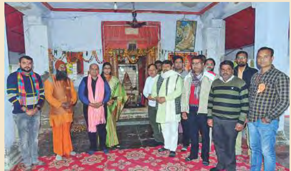
वाल्मीकि आश्रम बितूर में पूजन उपरांत