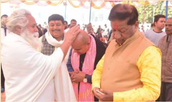
पवन तनय आश्रम में महंत जी का आशीर्वाद लेते हुए