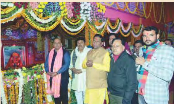
पवन तनय आश्रम में दर्शन करते हुए