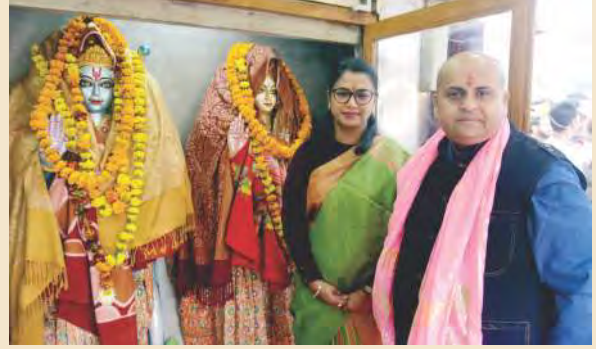
शारदा नगर स्थित रामदरबार में