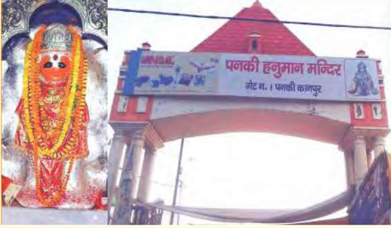
श्री पंचमुखी हनुमान मंदिर पनकी धाम