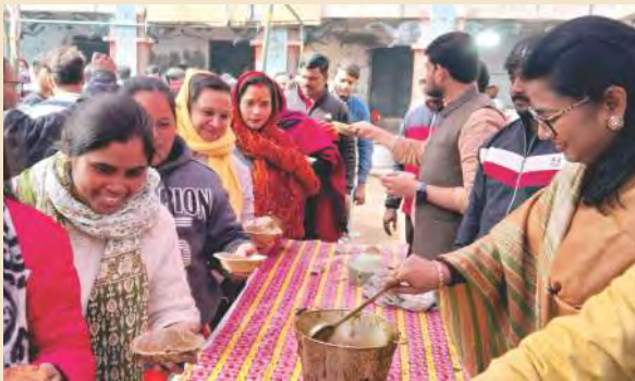
पनकी धाम में महिला श्रद्धालुओं को भंडारा प्रसाद वितरण