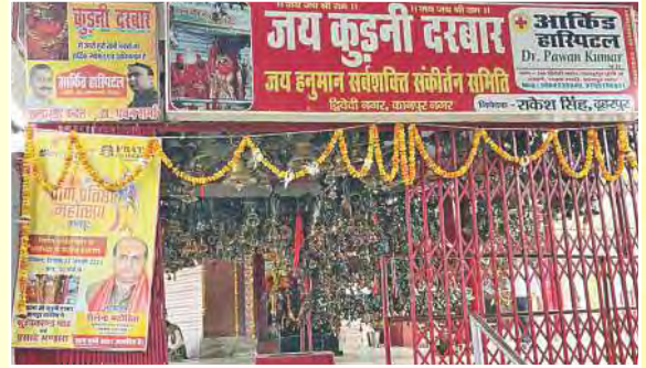
श्री हनुमान मंदिर कुड़नी दरबार, साढ़ भीतरगांव