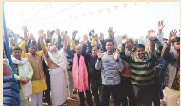
पवन तनय आश्रम में सजीव प्रसारण देख जय श्री राम का उद्घोष