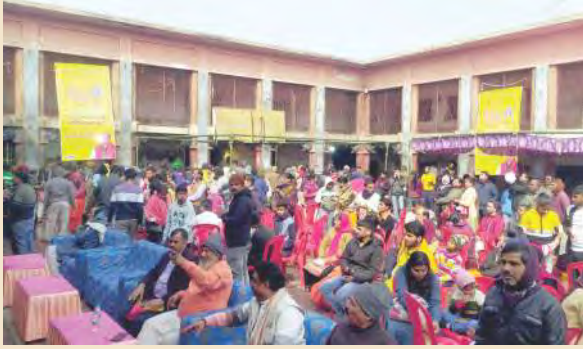
पनकी धाम में भंडारा व सजीव प्रसारण देखते भक्त