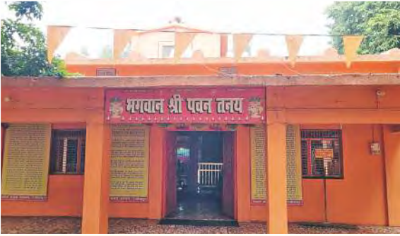
श्री पवन तनय आश्रम रंजीतपुर, भाऊपुर, कानपुर देहात