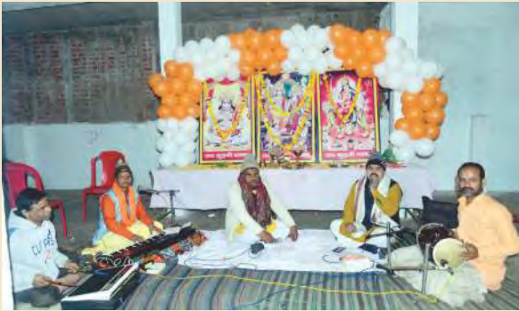
कुढ़नी दरबार में सुंदरकांड करते हुए