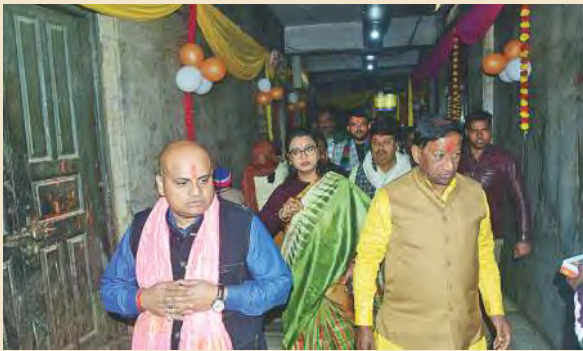
पनकी धाम में दर्शनोपरांत मंदिर परिक्रमा करते हुए