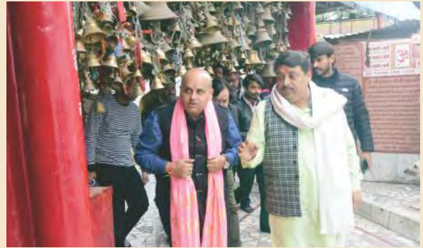
कुढ़नी दरबार में मंदिर परिक्रमा करते हुए