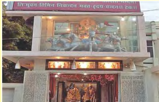
सूर्य मंदिर शारदा नगर