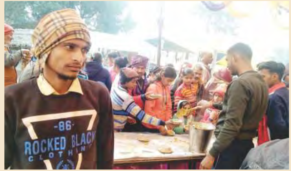
कुढ़नी दरबार में प्रसाद भंडारा वितरण