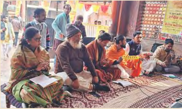
पनकी धाम में सुंदरकांड करते मंडली के लोग