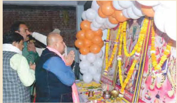
कुढ़नी मंदिर में रामदरबार में पूजा अर्चना करते हुए