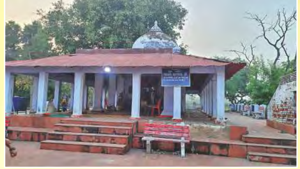
वाल्मीकि आश्रम, सीता रसोई बिहूर