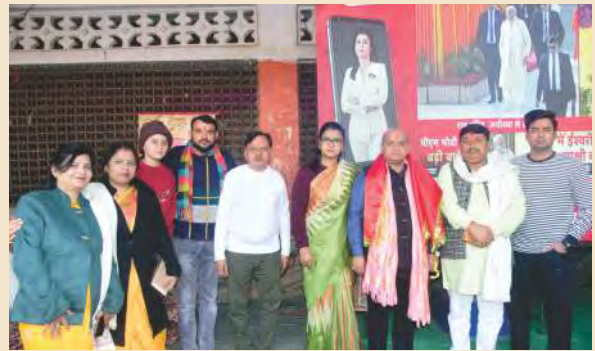
पनकी धाम में एलईडी पर सजीव प्रसारण के दौरान